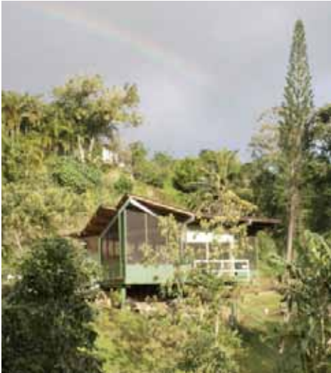
Boven links: Het autarkische huis.