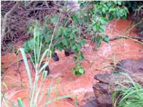
Boven: De Wailua River kleurde oranje door de eroderende aarde.