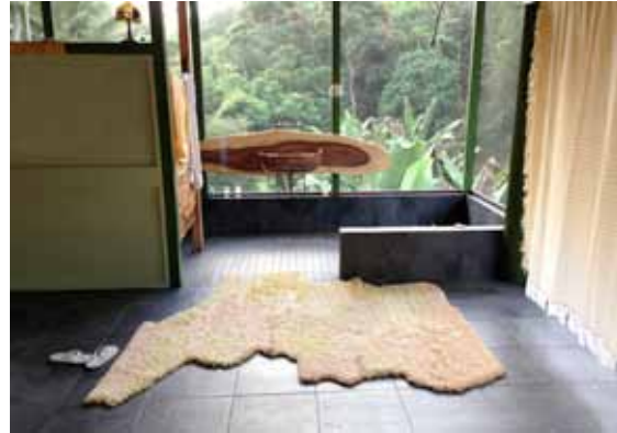
Bovenrechts: Het kleed in het interieur.